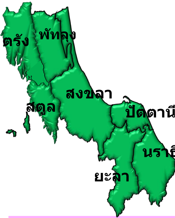
ครอบคลุมตรวจพัฒนาการ