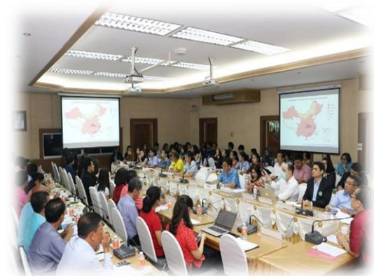
ประชุมคณะกรรมการโรคติดต่อจังหวัด 24/01/63