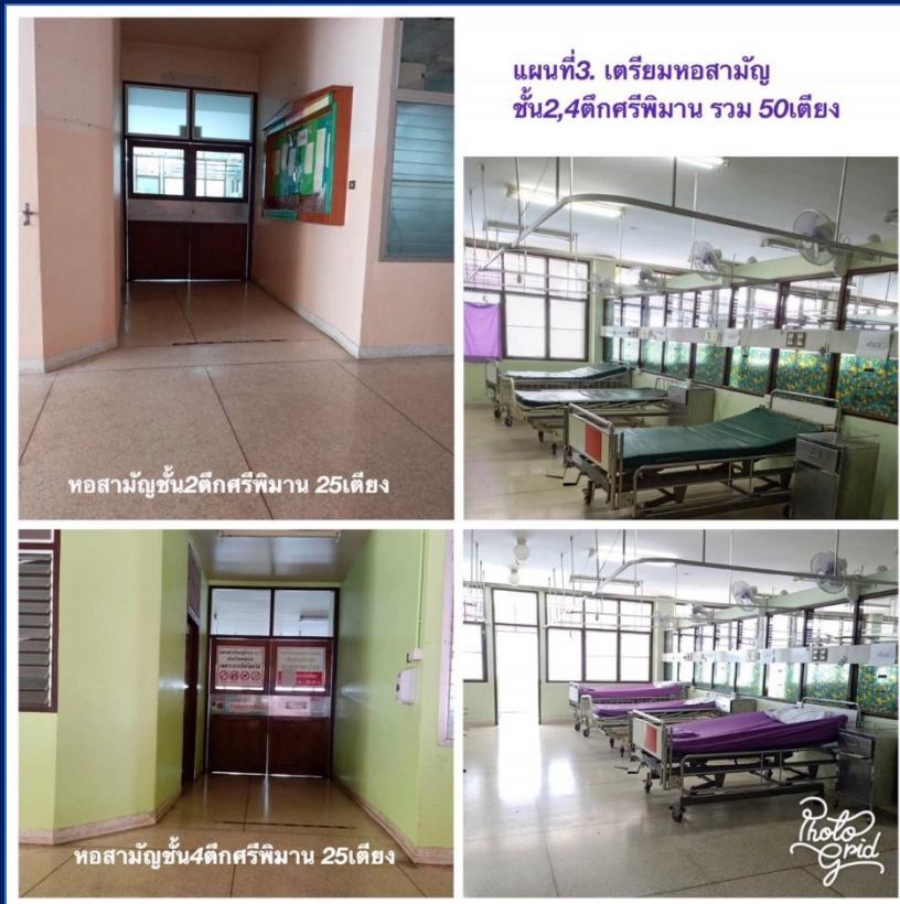
หอผู้ป่วยชั้น2ตึกศรีพิมาน 25เตียง