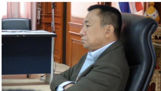
ผวจ.สตูลยกระดับการสแกน-เผื่อระวังนทพ.จีนเข้ามาเที่ยวในพื้นที่ สั่งเข้ม 4 จุดด่านตรวจทางบก ทะเล ป้องชาวสตูลเสี่ยง โควโรนา