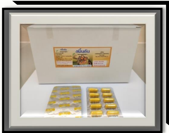
ไขมันชั้น 500 mg (สีเหลืองเข้ม)