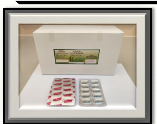
มะขามแขก 400 mg (สีขาวทึบ)