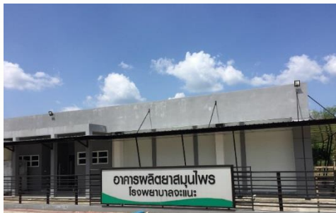
รพ.จะนะ (GMP แบบมีเงื่อนไข 2562 ) / (HALAL 2561)