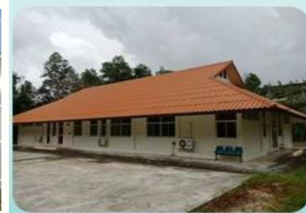
รพ. ป่าบอน (GMP 2559)