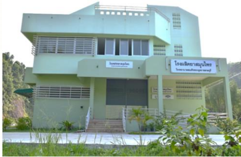
รพ.สายบุรี (GMP 2557) / (HALAL 2558)