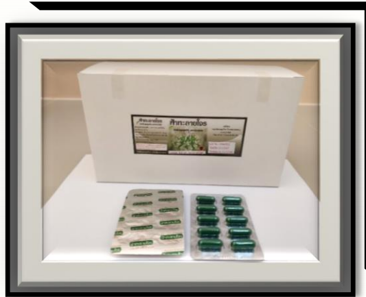
ฟ้าทะลายโจร 400 mg (สีเขียวเข้ม)