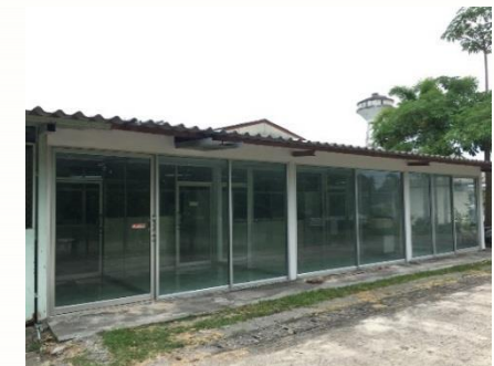
รพ.สิงหนคร