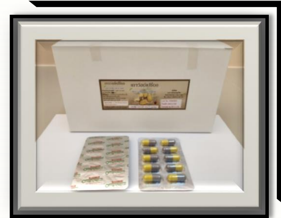
เกาวัลย์เปரியง 400 mg (สีเทา-เหลือง)