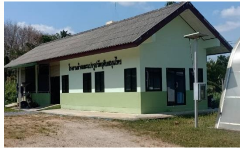
รพ.ห้วยยอด (GMP 2560)