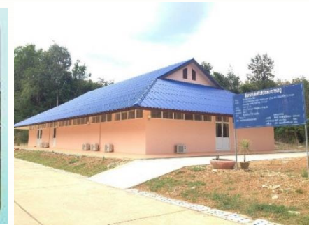
รพ.ละงู (GMP 2561)